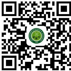
西科大微信企业号