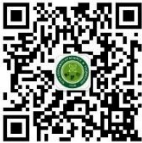
西科大微信订阅号

三、该计费调整 2018 年 12 月 10 日零点起开始进入试运行阶段，如有疑问或咨询请联系：